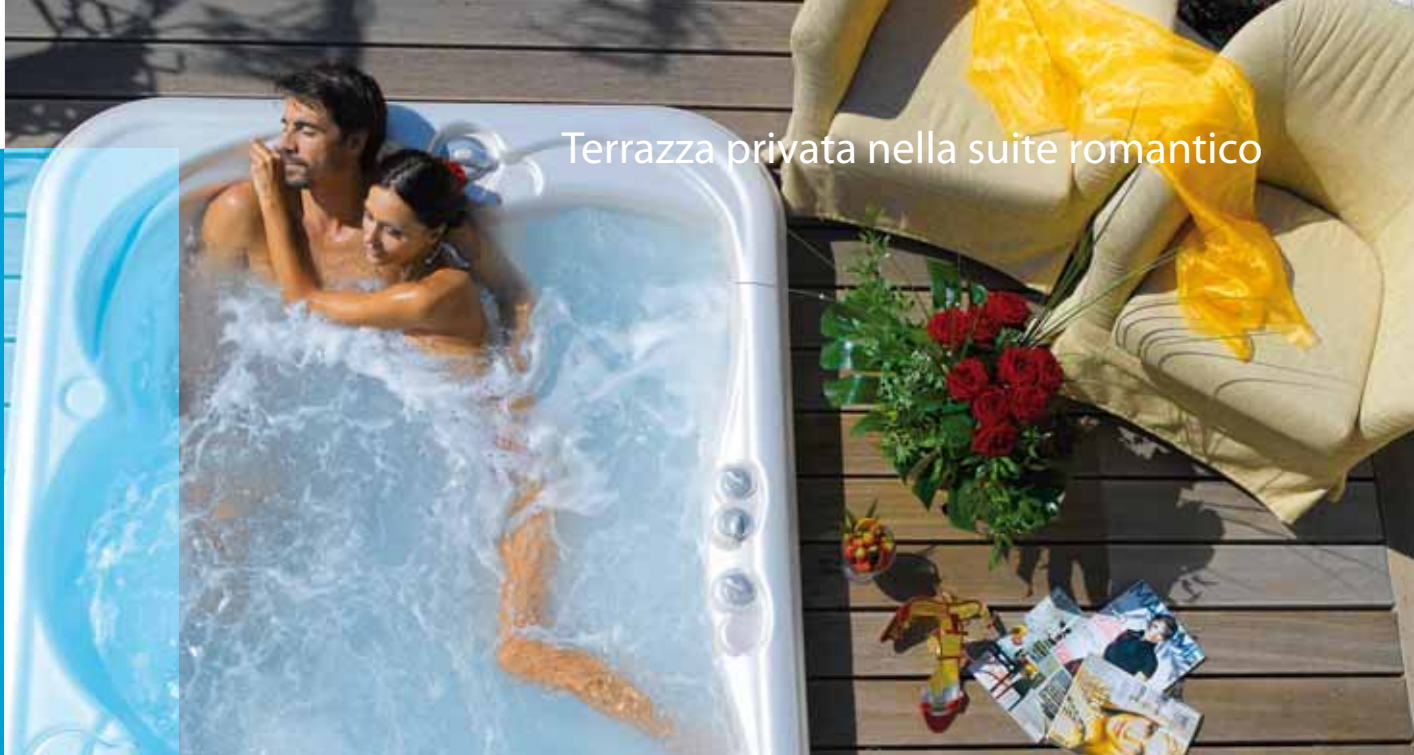
Terrazza privata nella suite romantico