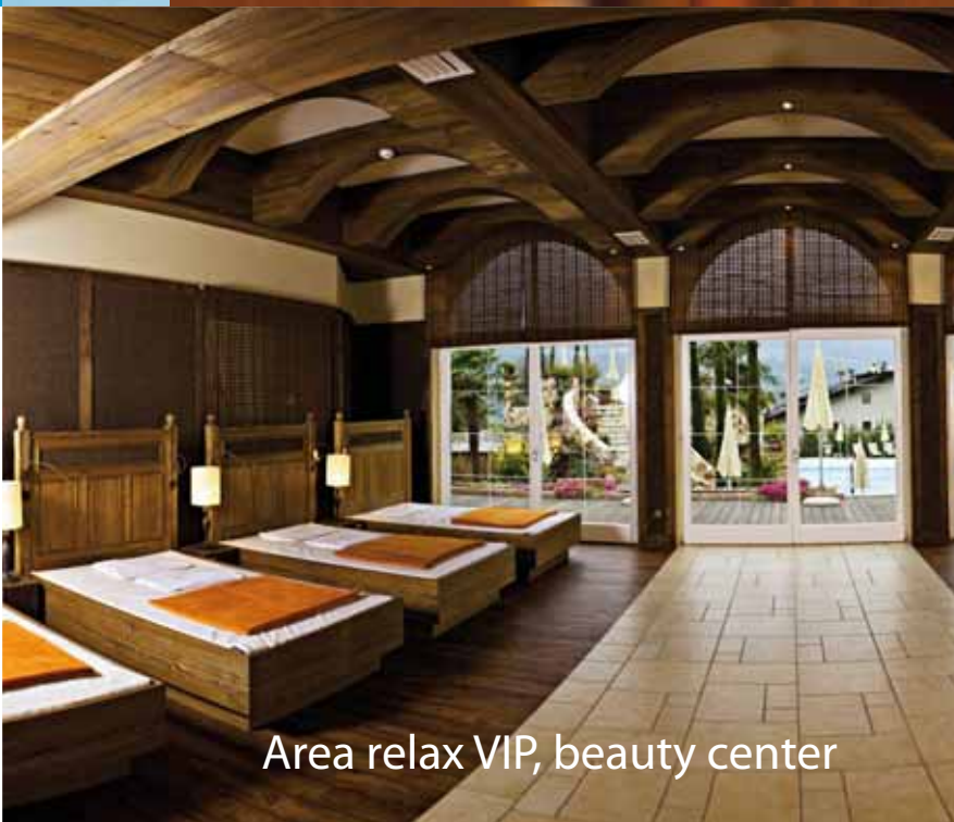
Area relax VIP, beauty center