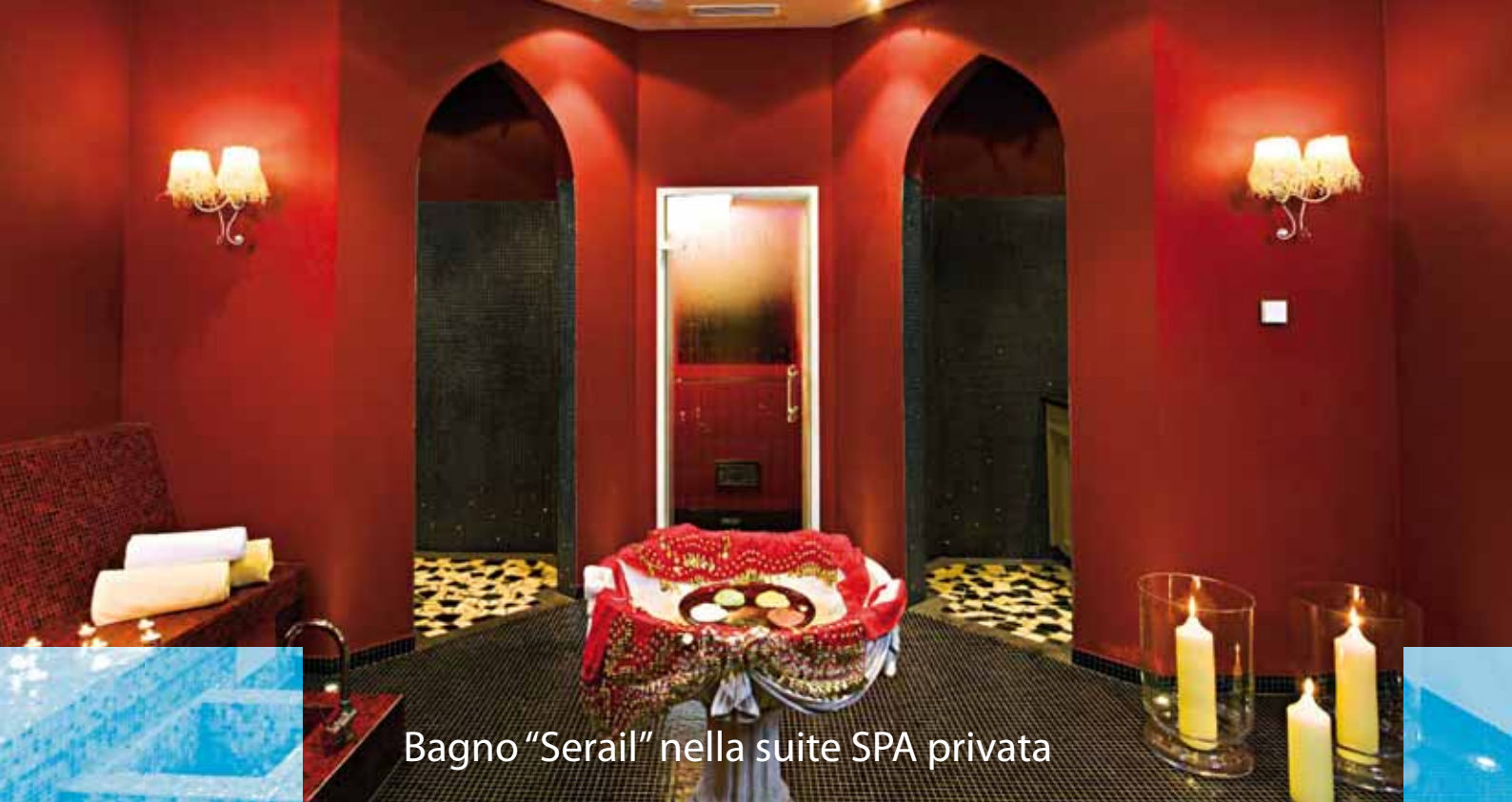
Bagno "Serail" nella suite SPA privata